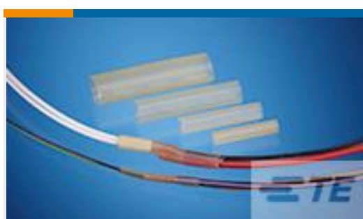
TE 产品编号7121976008 RBK-VWS-125-NR3-X-35MM