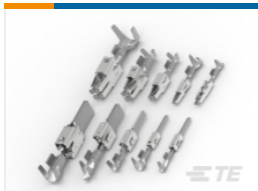
TE 产品编号969040-1 定时器, 母端和公端