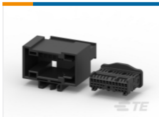
TE 产品编号144935-1 MOS 连接器外壳