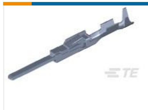
TE 产品编号5-1418758-2 MCON 1.2 LL TAB STC AU