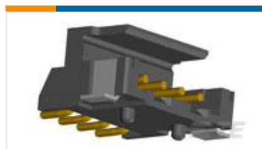
TE 产品编号292173-2 CT BOX HDR H SMT 2P O/TAPE BLA