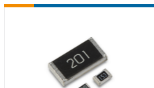
TE 产品编号3-2176328-3 CRGP 1206 4K7 1%