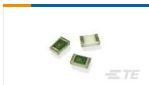
TE 产品编号1676261-2 RN 0805 23K2 0.1% 10PPM 1KRL