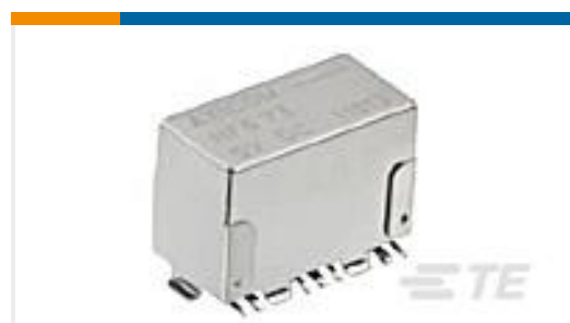
TE 产品编号1462052-3 HF6 53=50OHM140MW 5V MONO