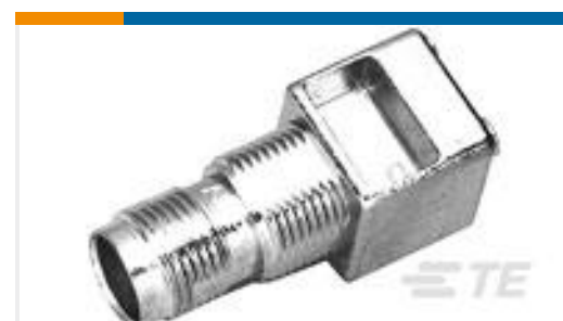
TE 产品编号5227839-1 TNC PCB RT ANGLE JACK