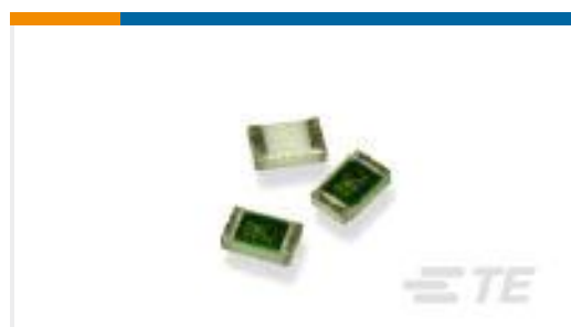
TE 产品编号1-1614959-3 CPF0805 1M8 0.1% 25PPM 1K RL