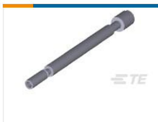
TE 产品编号201910-1 JACKSCREW KIT