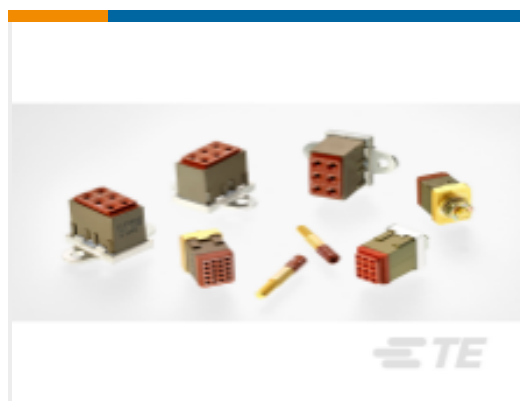
TE 产品编号CTJ720K01B-7067 MODULE ASSY