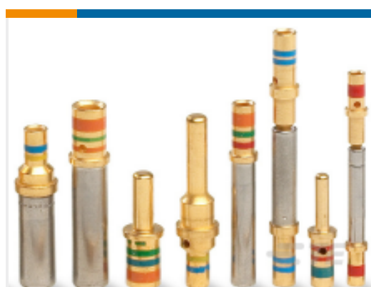
TE 产品编号1662-213-2031 CONT SOC ASSY