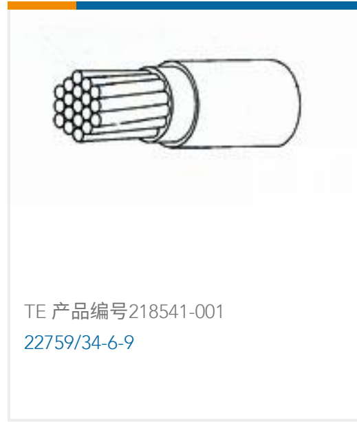
TE 产品编号218541-001 22759/34-6-9