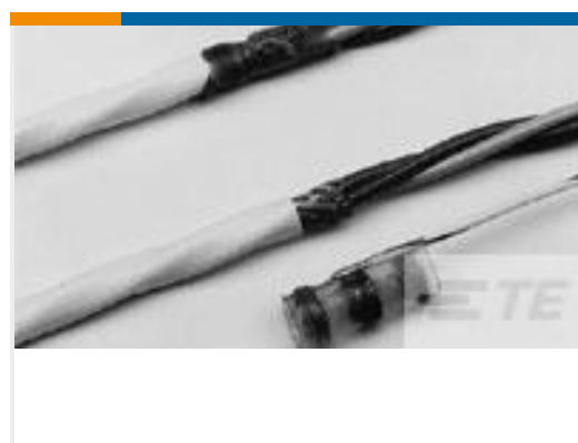
TE 产品编号764684-000 SO63-2-55-24-90