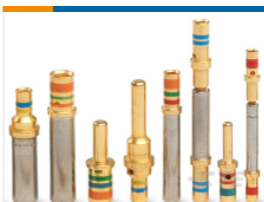
TE 产品编号 12331-20 CONT PIN