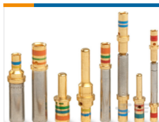
TE 产品编号12331-22 CONT PIN (182-0441-22)