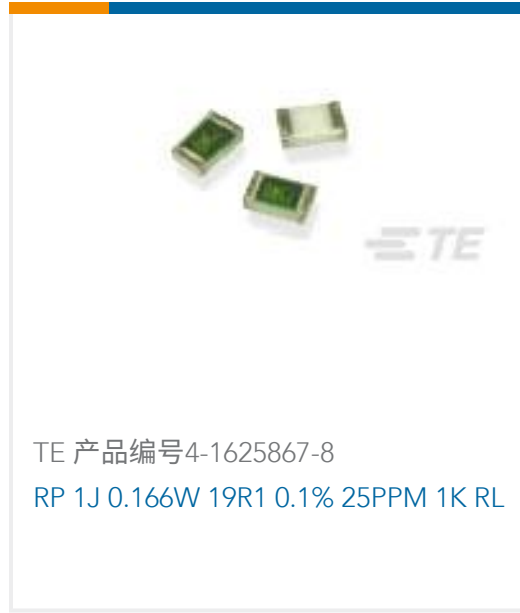
TE 产品编号4-1625867-8 RP 1J 0.166W 19R1 0.1% 25PPM 1K RL