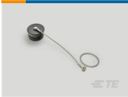
TE 产品编号YDTS32W25RV0010000 DUST COVER ASSEM