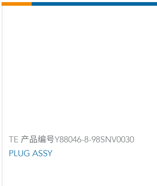
TE 产品编号Y88046-8-98SNV0030 PLUG ASSY