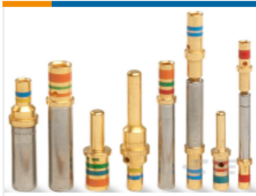
TE 产品编号 12333-20 CONT SOC ASSY