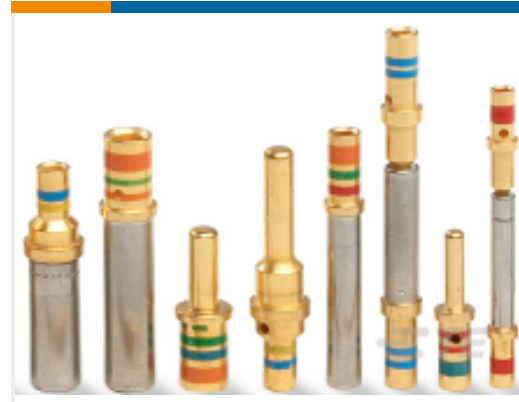
TE 产品编号12331-22 CONT PIN (182-0441-22)