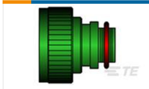
TE 产品编号106021-000 TXR54AB00-1408AI