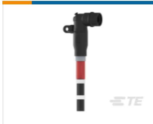
TE 产品编号EL8272-000 RSSS-VD-5251-FR01