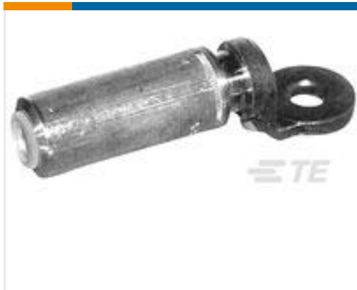
TE 产品编号739007-1 XCX 240 C4AU 240 (M)