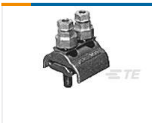
TE 产品编号709266-1 DPU-F 10-95 U-CMU 95R