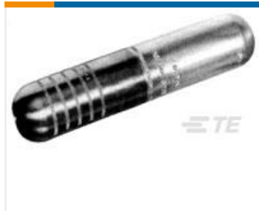
TE 产品编号1229974-1 XG8BM 50-RJ1A 50 (M)