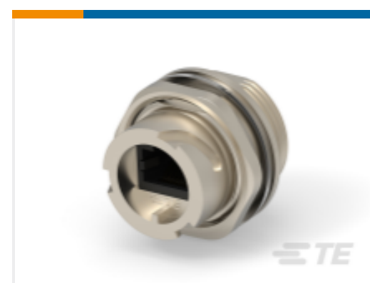
TE 产品编号2355443-1 RJ45 CAT5e PANEL MOUNT SOCKET