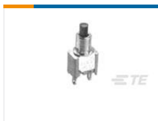
TE 产品编号1-1825098-2 TPC13F004