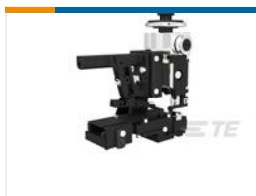
TE 产品编号2266192-1 OCEAN_2.0_Applicator-S-090F-RSM