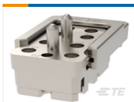
TE 产品编号2357971-1 ASSY, NanoRF BP module, V67, Combo