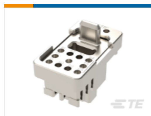
TE 产品编号2313391-1 ASSEMBLY, HYBRID NanoRF/MT BP MODULE