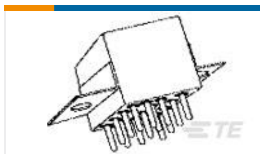
TE 产品编号7-1617760-9 FCB-405-0619M=M83536/6-019M