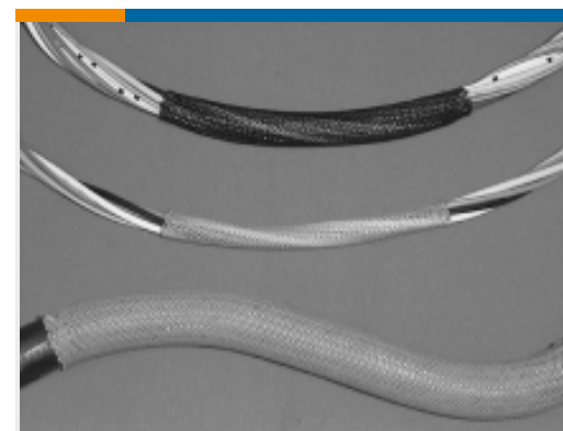
TE 产品编号CH02084001 VERSAFLEX Heat Shrink Tubing