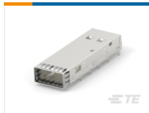
TE 产品编号2170322-6 QSFP cage, Solder, No HS Opening, finger