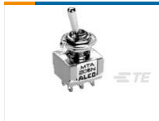
TE 产品编号7-1437558-5 MTE206R=(MSTE) SW TOG WATERPRO