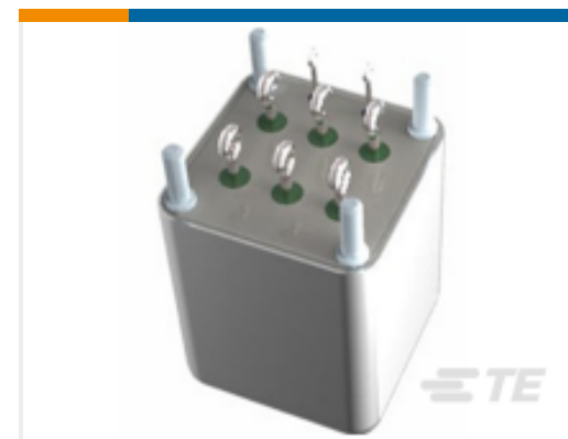
TE 产品编号4-1617806-2 FC-325-3=MS27418-1C