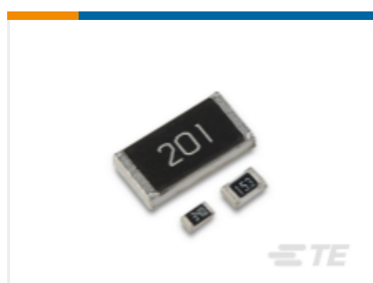
TE 产品编号2-2176330-0 CRGP 2010 390R 1%