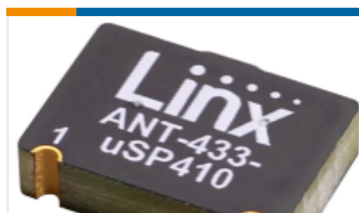
TE 产品编号ANT-433-USP410 Antenna uSP PCB RPC 410 433MHz SMT T&R