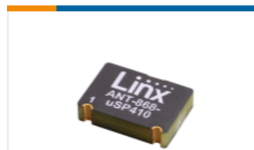
TE 产品编号L9000152-01 Antenna uSP PCB RPC 410 868MHz SMT T&R