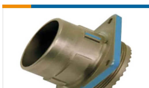
TE 产品编号YDIV44E15-05PNC009 RECP ASSY