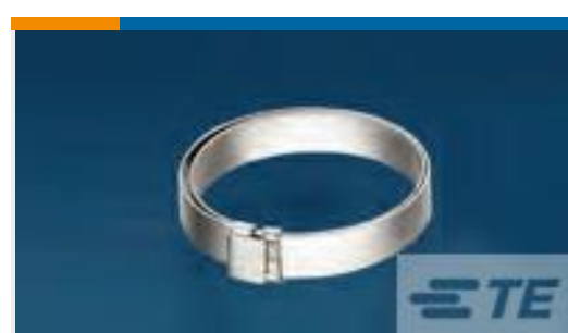
TE 产品编号A22867-000 BND-1225-S