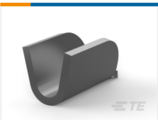
TE 产品编号 62157-2 SPLICE AMVAR600TO3000 .020TPBR