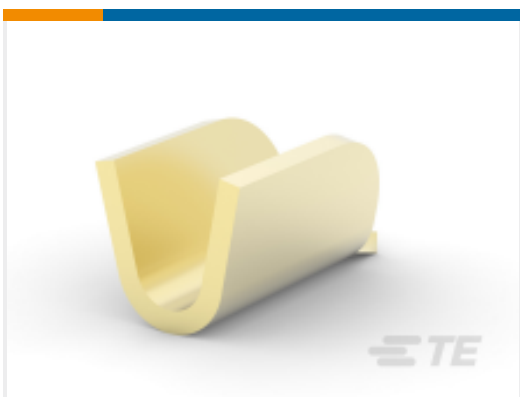
TE 产品编号 62157-1 SPLICE AMVAR 600-3000 .020BR