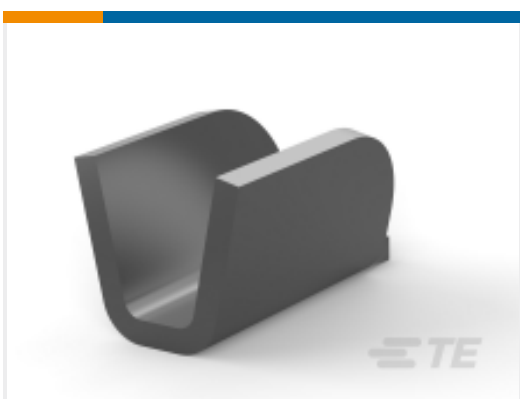
TE 产品编号 62304-2 AMVAR SPLC 600-3000 020TPBR