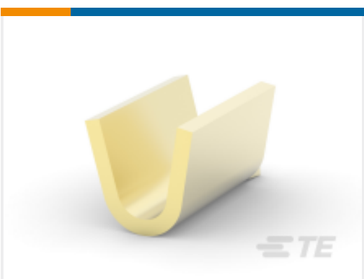
TE 产品编号 170152-3 AMP SPLICE