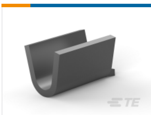
TE 产品编号 170152-4 AMP SPLICE