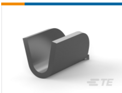
TE 产品编号 62000-2 SPLICE AMVAR 600-3000 020TPBR