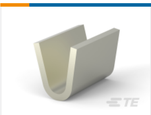
TE 产品编号 140837-2 SPLICE AMPLIVAR