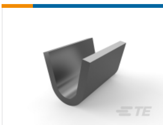
TE 产品编号 170152-2 AMPLIVAR SPLICE STR