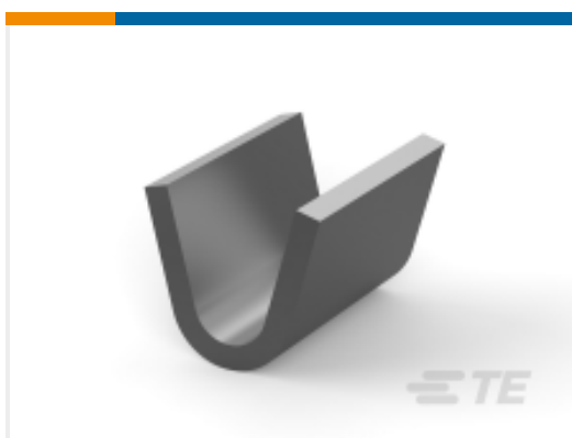
TE 产品编号 280007-2 AMPLIVAR SPLICE TIN PLATED