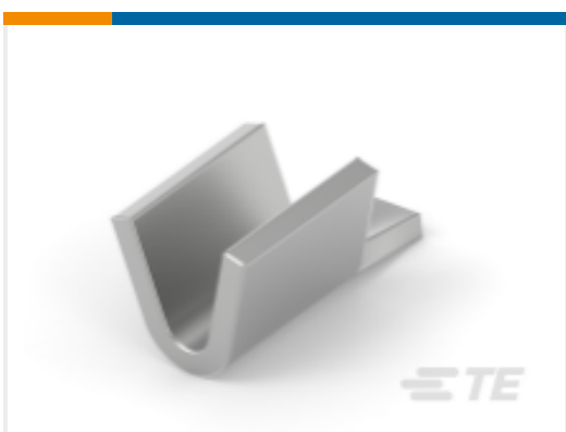
TE 产品编号 63621-2 SPLICE S-MINI/AMVAR 0098TPCUBR