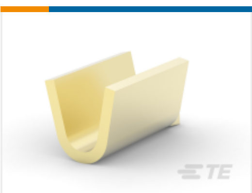
TE 产品编号 42076 SPLC AMVAR 600-3000 020BR