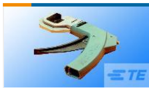
TE 产品编号58247-1 MTA 156 CRIMP HEAD REPAIR DISCRETE