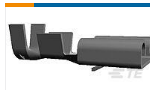
TE 产品编号5-160558-2 FF 250 REC 0.5-1.5MM2 TPBR