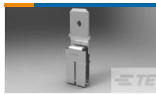
TE 产品编号63598-1 MAG-MATE 250 F-TAB TPBR