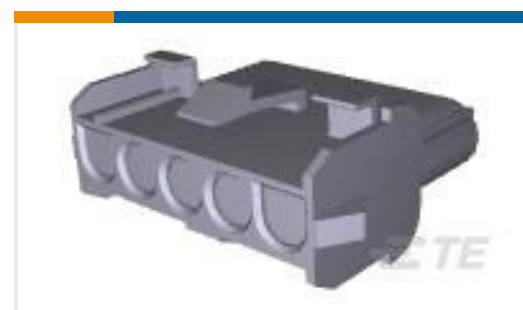
TE 产品编号350810-1 05P UMNL CAP HSG