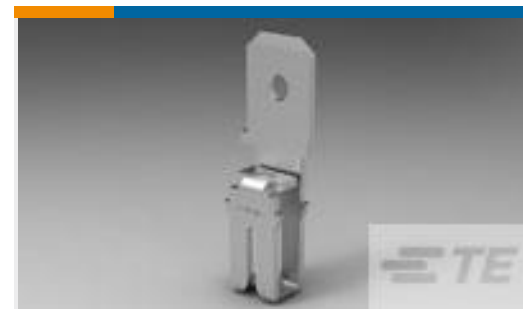
TE 产品编号63665-1 MAG-MATE 187 FAST TAB 020TPBR