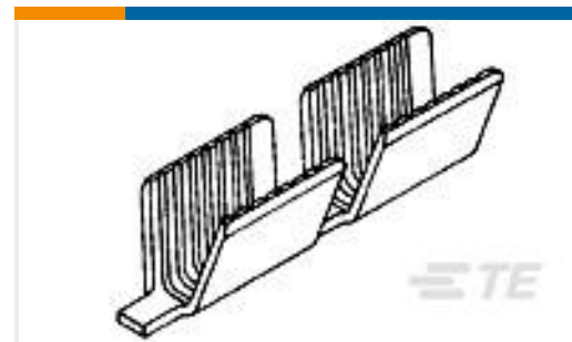
TE 产品编号62000-1 SPLICE AMVAR 600-3000 020BR