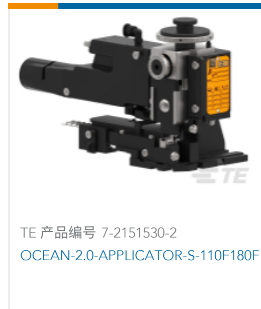
TE 产品编号 7-2151530-2 OCEAN-2.0-APPLICATOR-S-110F180F