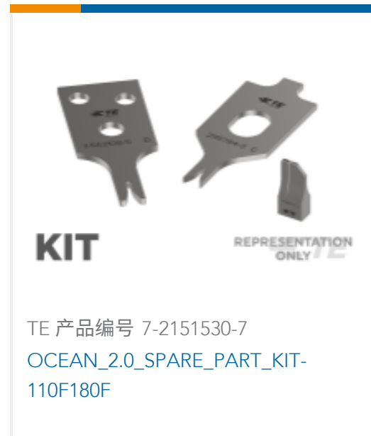
TE 产品编号 7-2151530-7 OCEAN_2.0_SPARE_PART_KIT-110F180F