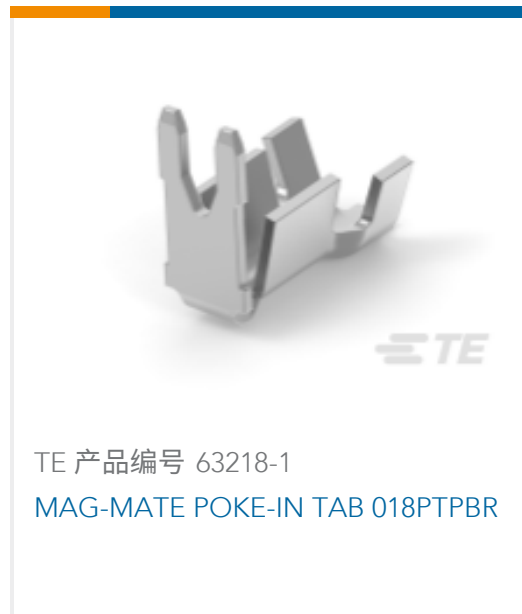
TE 产品编号 63218-1 MAG-MATE POKE-IN TAB 018PTPBR