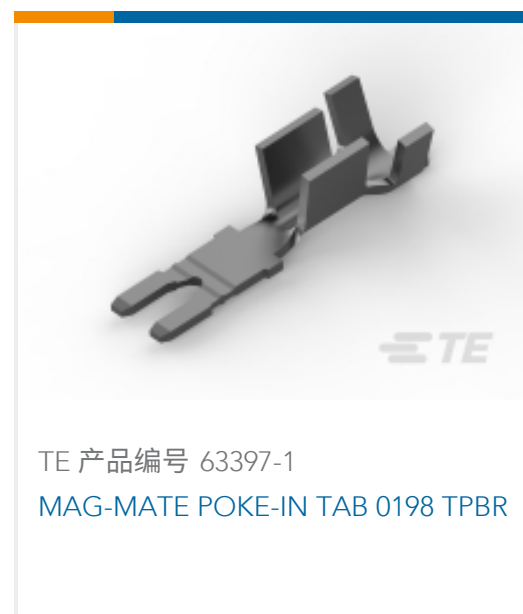
TE 产品编号 63397-1 MAG-MATE POKE-IN TAB 0198 TPBR