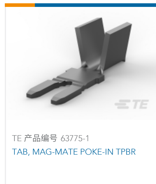
TE 产品编号 63775-1 TAB, MAG-MATE POKE-IN TPBR