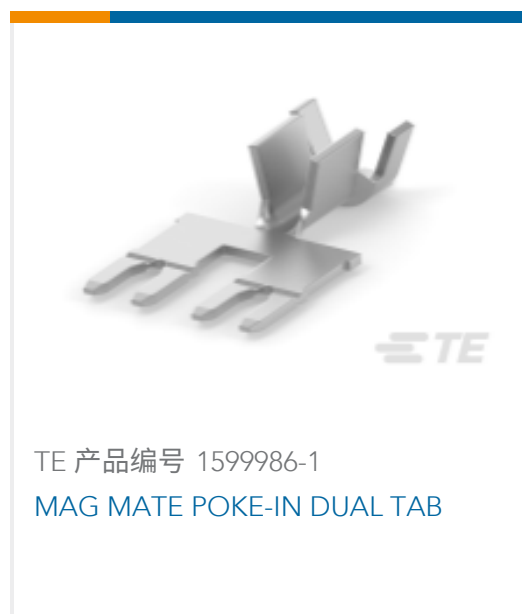
TE 产品编号 1599986-1 MAG MATE POKE-IN DUAL TAB