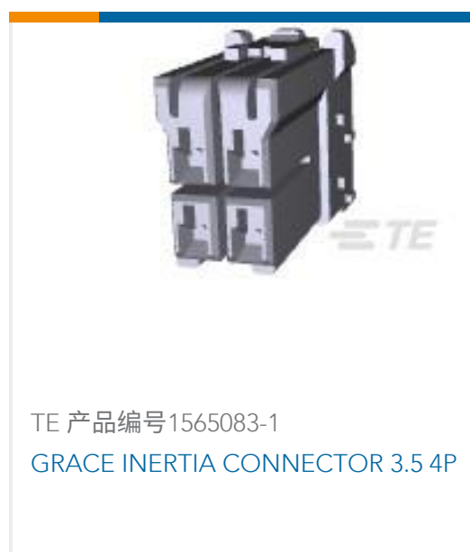
TE 产品编号1565083-1 GRACE INERTIA CONNECTOR 3.5 4P