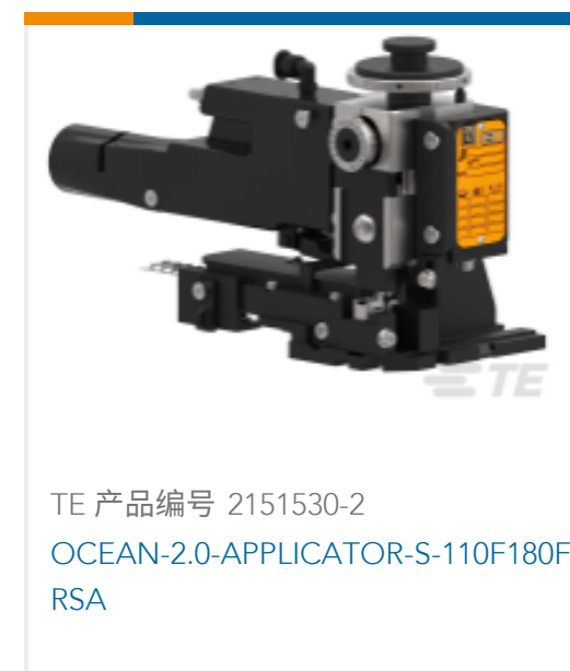
TE 产品编号 2151530-2 OCEAN-2.0-APPLICATOR-S-110F180F-RSA