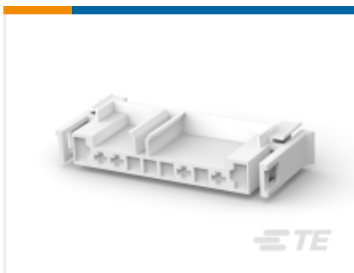
TE 产品编号1897058-1 CONNECTOR .125/.250 SERIES