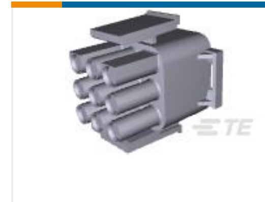
TE 产品编号794537-1 09P UMNL PLUG HSG 150C BLK