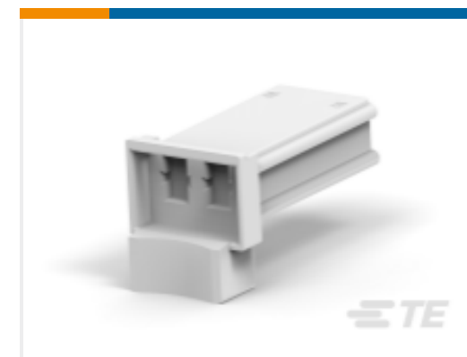
TE 产品编号2-1743216-1 GAS VALVE 2P HSG GWT