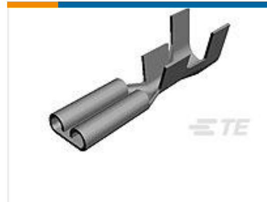
TE 产品编号41728 250 FASTON REC 16-12 AWG TPBR