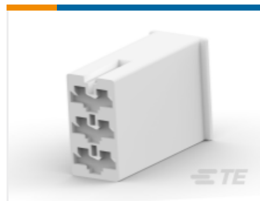
TE 产品编号2-1743068-1 187 HSG. PL MKII REC. 5mm 3P NAT