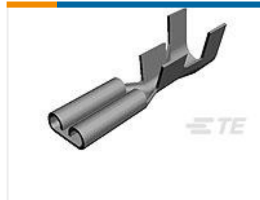
TE 产品编号2232112-1 250 FASTON, REC., 18-14 AWG, TPBR