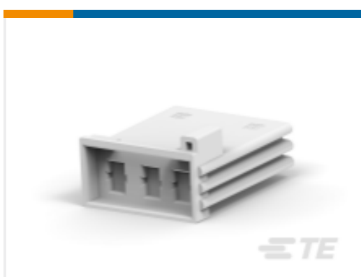
TE 产品编号2-1743217-1 GAS VALVE 3P HSG GWT