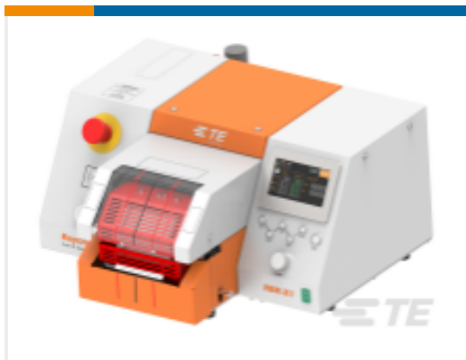
TE 产品编号 1-2234800-4 RBK-X1 CE, W/ AIR COOLING