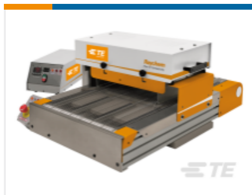
TE 产品编号 2326489-1 MODEL 105 TUNNEL OVEN, 36" ENTRY, STAND