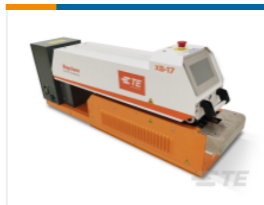
TE 产品编号 2375310-2 XB17 Belt Heater, 110V