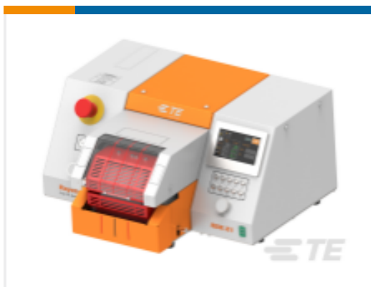
TE 产品编号 2234800-2 RBK-X1 CE STD