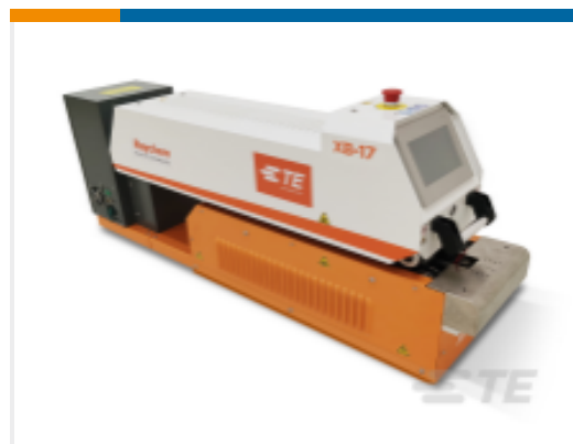
TE 产品编号 2375310-1 XB17 Belt Heater, 220V