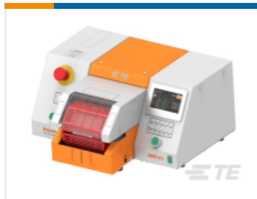
TE 产品编号 1-2234800-1 RBK-X1, AUTO TRIGGER