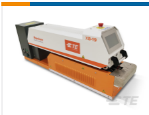
TE 产品编号 2375320-1 XB19 Belt Heater, STD