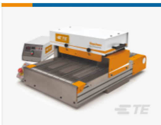
TE 产品编号 955018-000 CLTEQ-M105-TUNNEL-OVEN