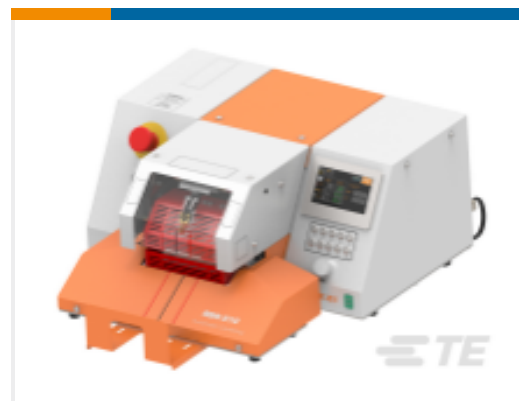
TE 产品编号 2376800-2 RBK-X1C CE STD