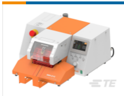
TE 产品编号 1-2376800-4 RBK-X1C CE, W/ AIR COOLING