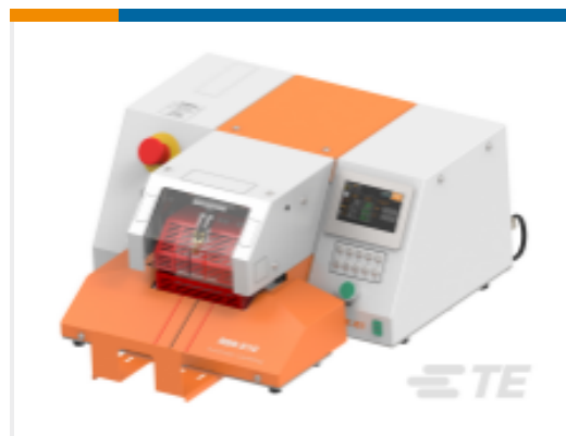
TE 产品编号 2376800-1 RBK-X1C STD