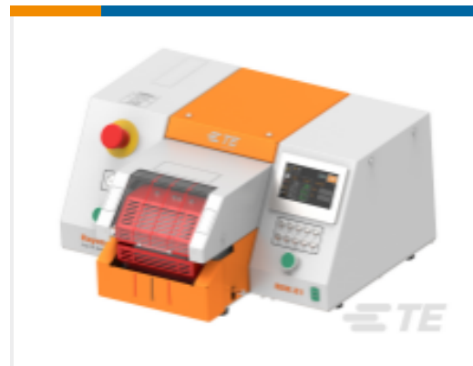
TE 产品编号 2234800-1 RBK-X1 STD