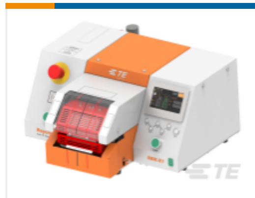
TE 产品编号 1-2234800-3 RBK-X1, W/ AIR COOLING