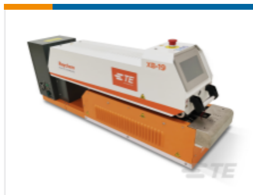
TE 产品编号 2375320-2 XB19 Belt Heater, 150mm (6") Version