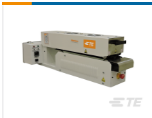
TE 产品编号 2280355-1 220 V MODEL 17