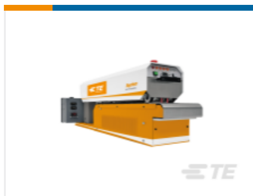
TE 产品编号 714529-000 CLTEQ-M19-BELT-HTR