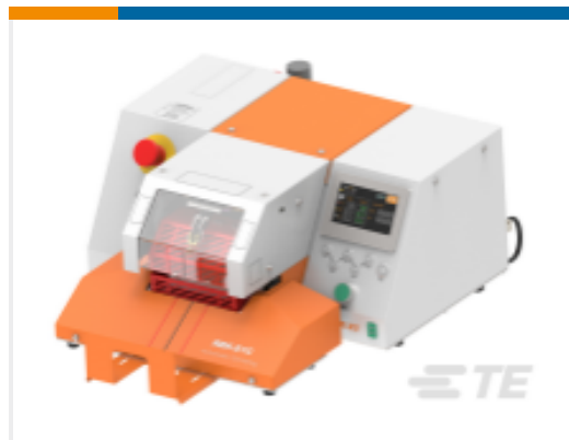
TE 产品编号 1-2376800-3 RBK-X1C, W/ AIR COOLING