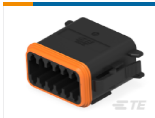
TE 产品编号DT06-12SB-P004 PLG, 12P, BLK, N, B