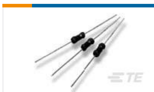
TE 产品编号3-1625892-5 3W SM M/OX 5% 27K