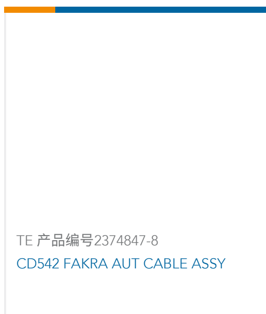
TE 产品编号2374847-8 CD542 FAKRA AUT CABLE ASSY