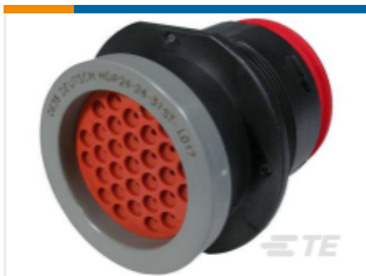
TE 产品编号HDP24-24-31ST-L017 REC, 31P, BLK, T, RNG, 16, S