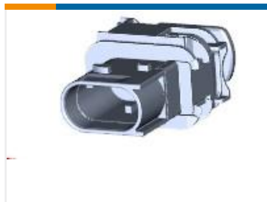
TE 产品编号1-1670730-1 3POS,TAB 1.5X0.63,TAB HSG,ASSY