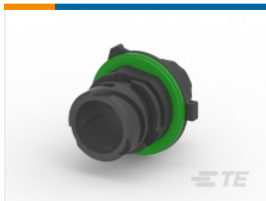
TE 产品编号1-967402-3 2,5MM ST-GEH KPL 2P