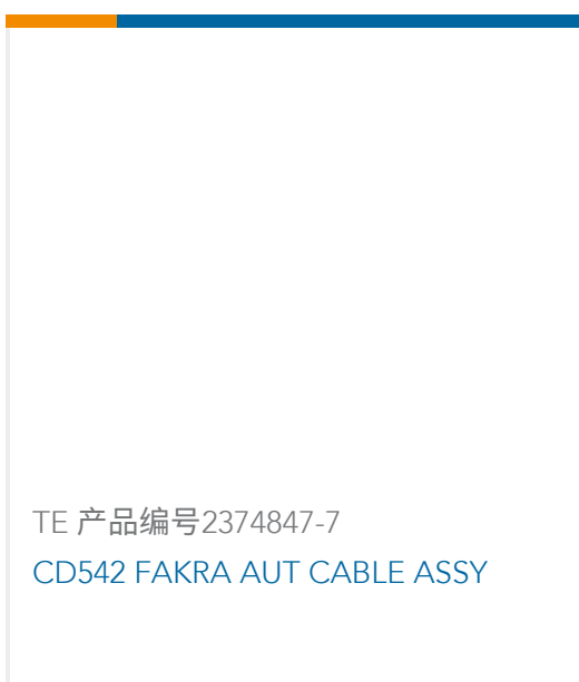
TE 产品编号2374847-7 CD542 FAKRA AUT CABLE ASSY