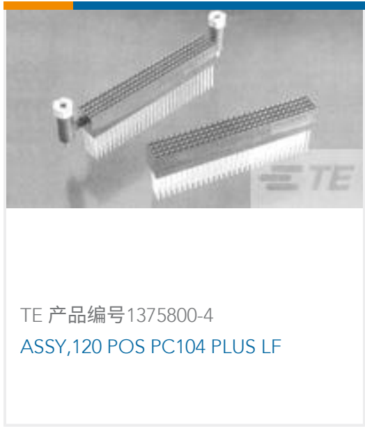
TE 产品编号1375800-4 ASSY,120 POS PC104 PLUS LF