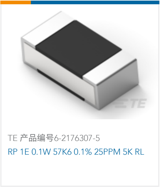
TE 产品编号6-2176307-5 RP 1E 0.1W 57K6 0.1% 25PPM 5K RL