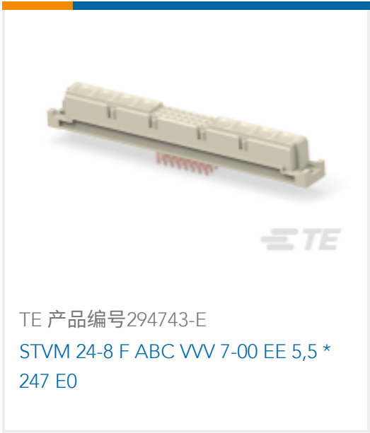
TE 产品编号294743-E STVM 24-8 F ABC VV 7-00 EE 5,5 * 247 E0