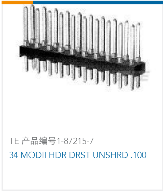
TE 产品编号1-87215-7 34 MODII HDR DRST UNSHRD .100