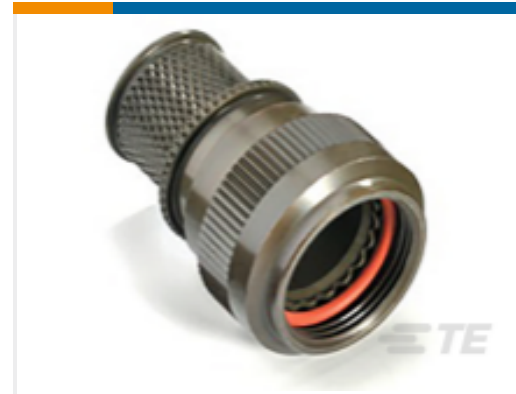
TE 产品编号BTH1-11-08-1-B-SB BTH1-11-08-1-B-SB