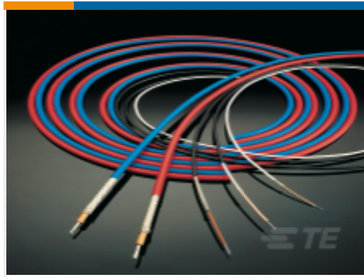
TE 产品编号750391-000 7528F5814-0