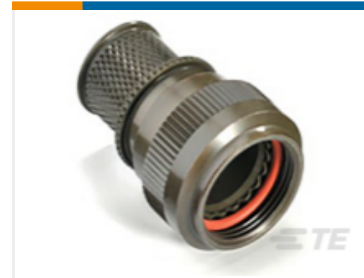
TE 产品编号BTH1-25-18-4-J BTH1-25-18-4-J