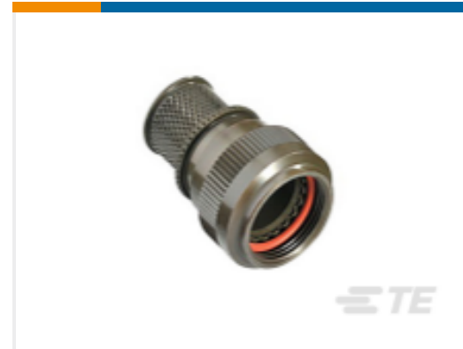
TE 产品编号BTA1-22-16-1-B-SB BTA1-22-16-1-B-SB