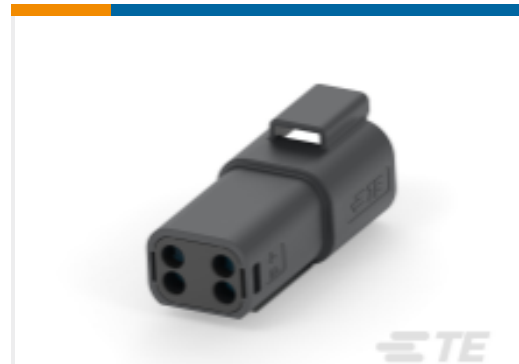
TE 产品编号1-2600030-0 4CCT BLACK RECEP W/LARGE SEAL