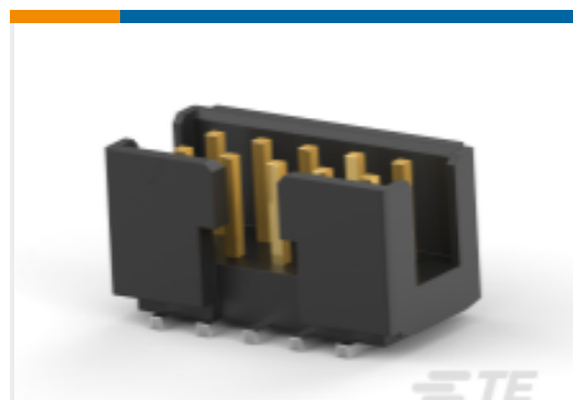
TE 产品编号1-2373376-0 10P,2MM,SHRD HDR,DRV,T,SMD,0.1 AU,TB