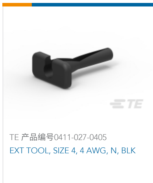
TE 产品编号0411-027-0405 EXT TOOL, SIZE 4, 4 AWG, N, BLK