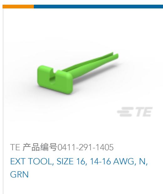
TE 产品编号0411-291-1405 EXT TOOL, SIZE 16, 14-16 AWG, N, GRN