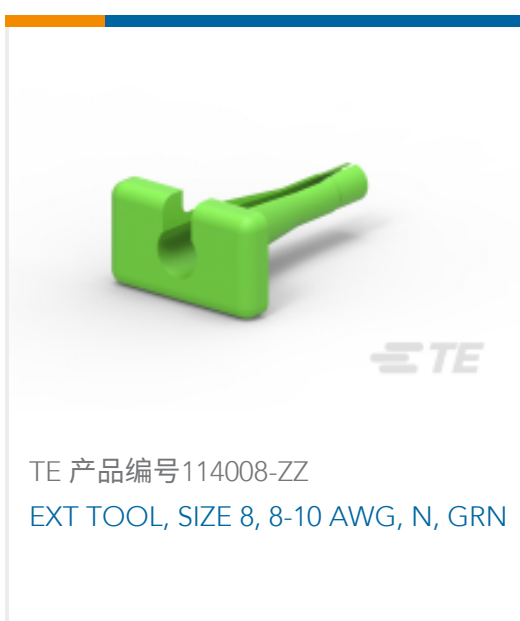
TE 产品编号114008-ZZ EXT TOOL, SIZE 8, 8-10 AWG, N, GRN