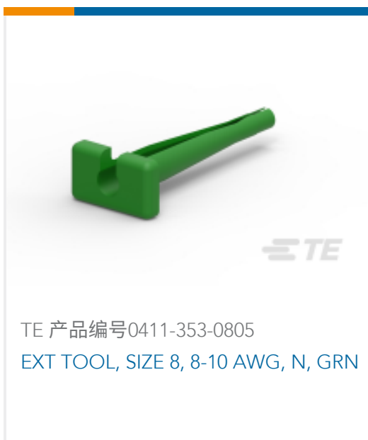
TE 产品编号0411-353-0805 EXT TOOL, SIZE 8, 8-10 AWG, N, GRN