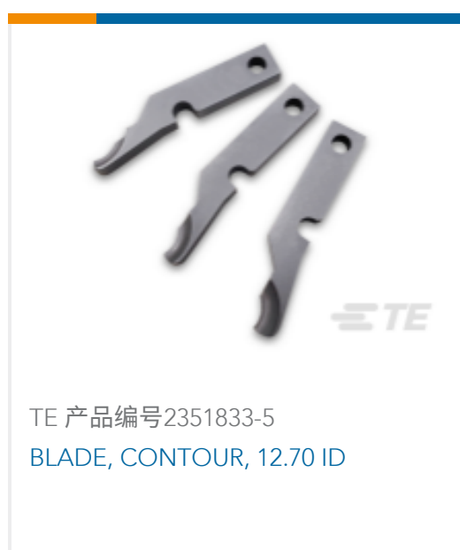
TE 产品编号2351833-5 BLADE, CONTOUR, 12.70 ID