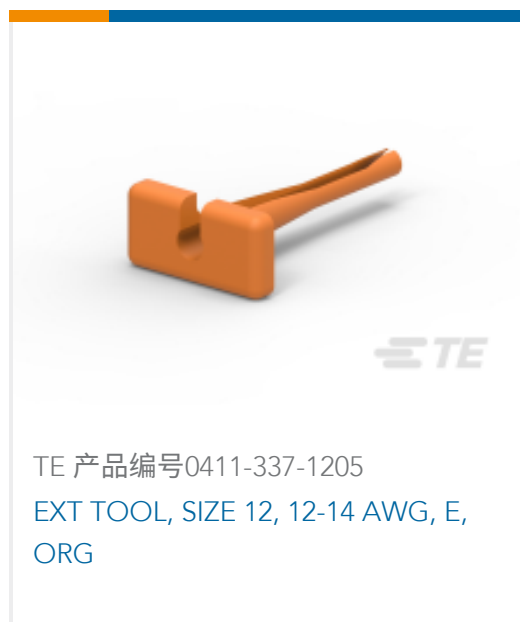
TE 产品编号0411-337-1205 EXT TOOL, SIZE 12, 12-14 AWG, E, ORG