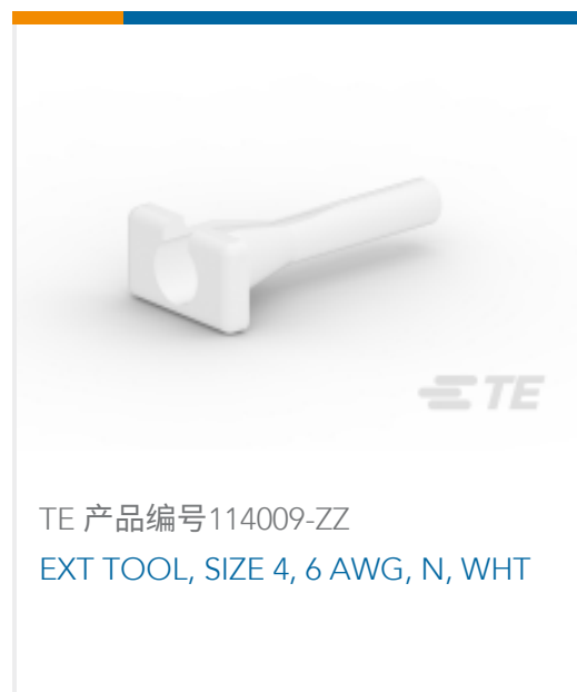
TE 产品编号114009-ZZ EXT TOOL, SIZE 4, 6 AWG, N, WHT ORG