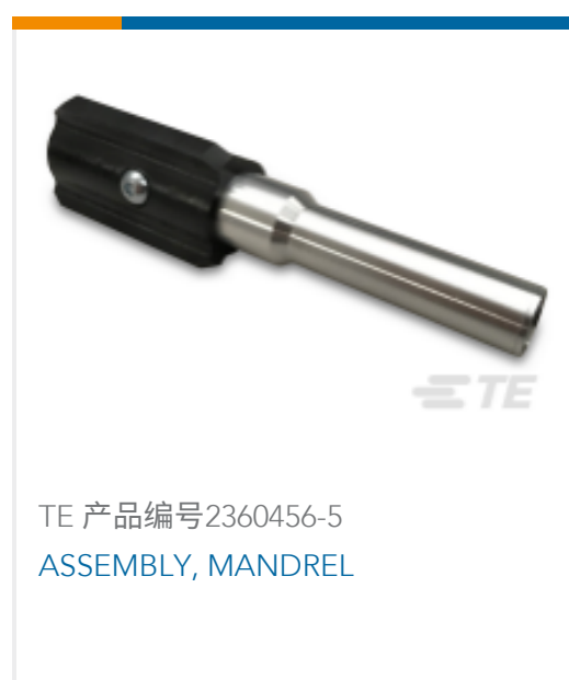
TE 产品编号2360456-5 ASSEMBLY, MANDREL