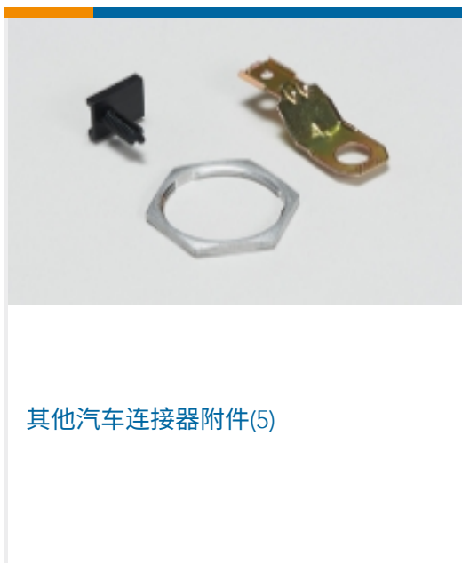
其他汽车连接器附件(5)