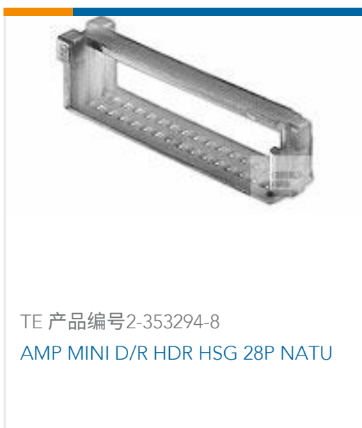
TE 产品编号2-353294-8 AMP MINI D/R HDR HSG 28P NATU