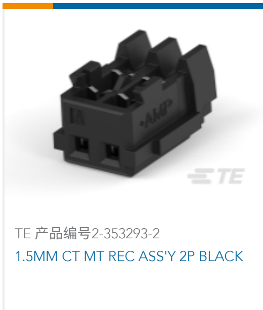
TE 产品编号2-353293-2 1.5MM CT MT REC ASS'Y 2P BLACK