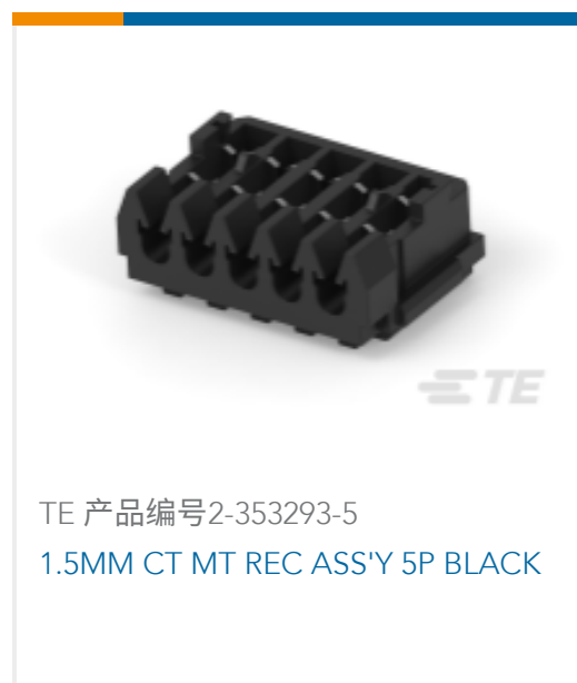
TE 产品编号2-353293-5 1.5MM CT MT REC ASS'Y 5P BLACK