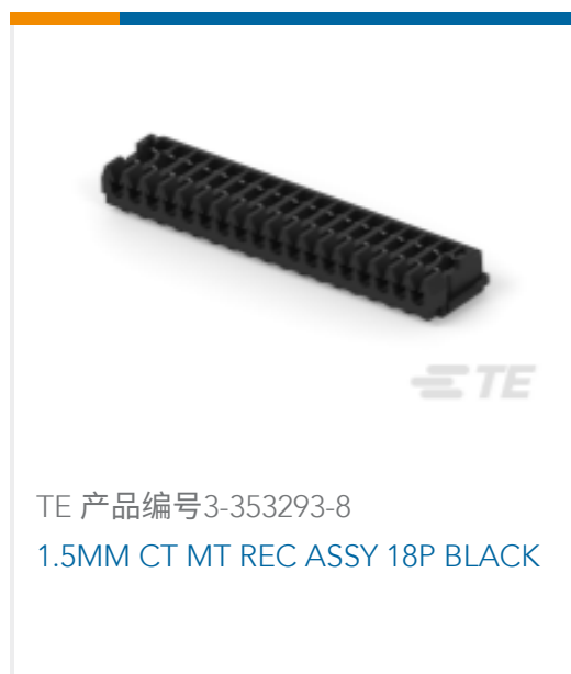
TE 产品编号3-353293-8 1.5MM CT MT REC ASSY 18P BLACK