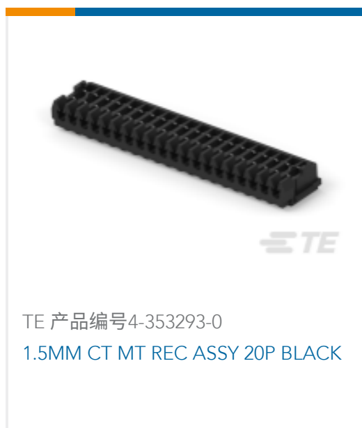
TE 产品编号4-353293-0 1.5MM CT MT REC ASSY 20P BLACK