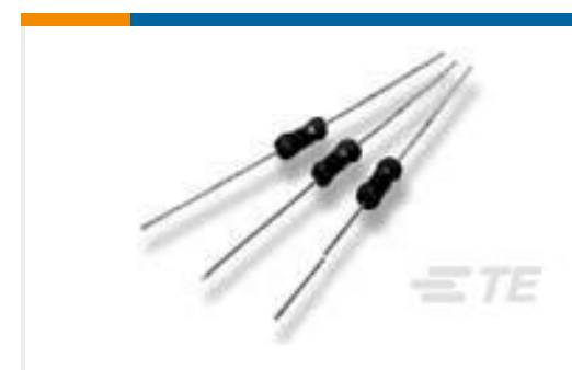
TE 产品编号1-1625893-4 5W SM M/OX 2% 27R