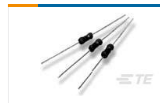
TE 产品编号7-1879350-5 RR01 5% 270R AMMO