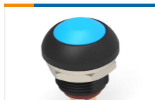
TE 产品编号2-2329383-5 PB ON/OFF FC BLU M1 TERM IP68