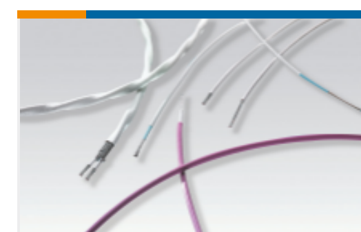
TE 产品编号CJ1465-000 55AC8113-22-9/96-9-9CS2275