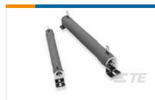
TE 产品编号1-1879447-8 TE 200W 27R 5% Bracket