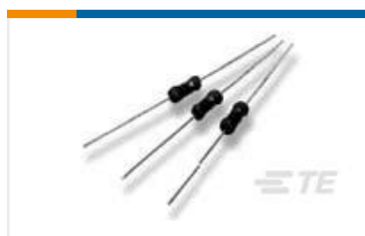
TE 产品编号4-1879355-9 RR03 5% 430K AMMO