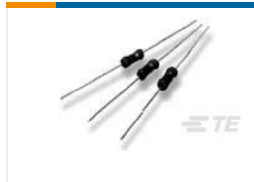
TE 产品编号1-1625893-4 5W SM M/OX 2% 27R