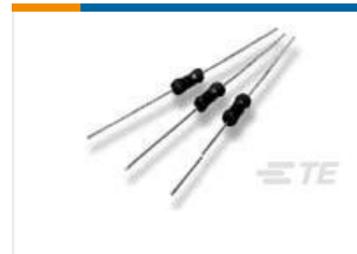
TE 产品编号7-1879350-5 RR01 5% 270R AMMO