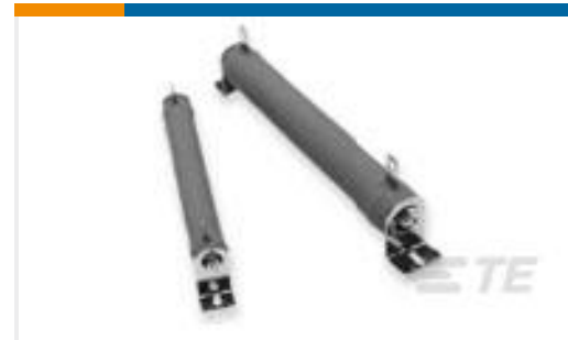
TE 产品编号1-1879447-8 TE 200W 27R 5% Bracket