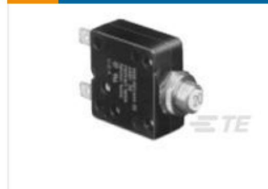
TE 产品编号1393249-5 W58-XB1A4A-1=W58