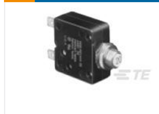
TE 产品编号1-1393249-4 W58-XB1A4A-3=W58