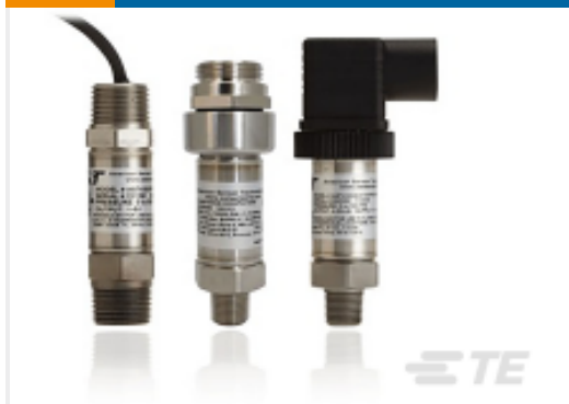
TE 产品编号11106455-00 667 PSI, SAE4 Female Schraeder, 0.5-4.5V