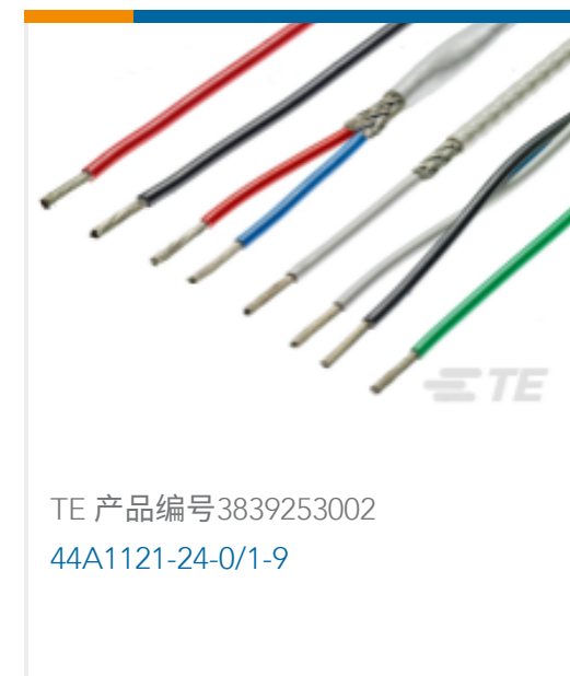
TE 产品编号3839253002 44A1121-24-0/1-9