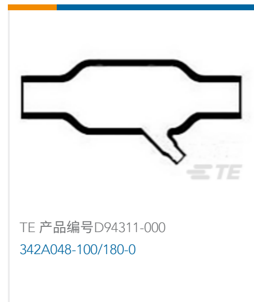
TE 产品编号D94311-000 342A048-100/180-0