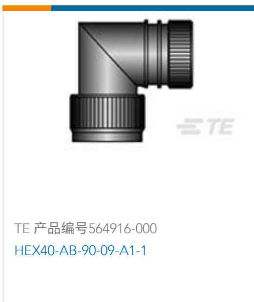
TE 产品编号564916-000 HEX40-AB-90-09-A1-1