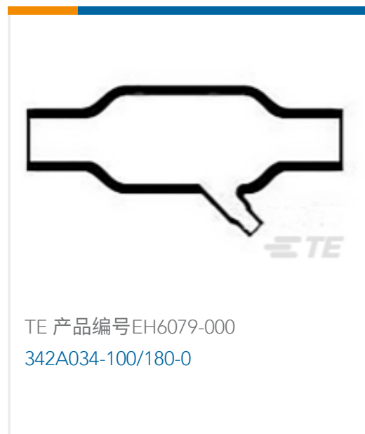
TE 产品编号EH6079-000 342A034-100/180-0