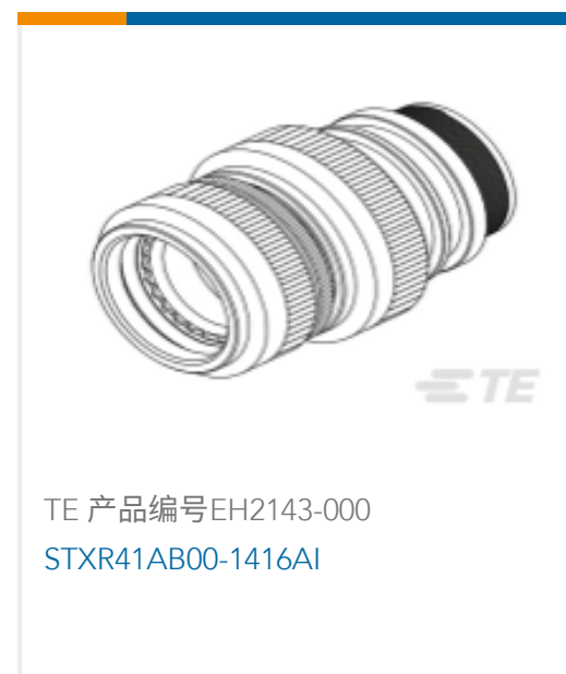
TE 产品编号EH2143-000 STXR41AB00-1416AI