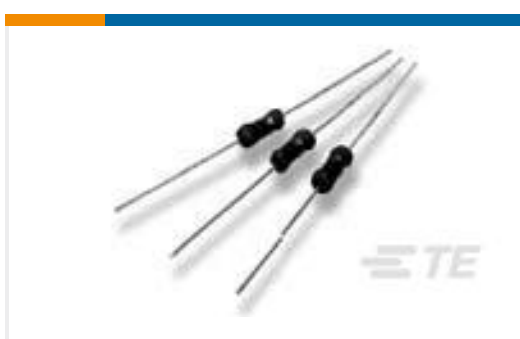
TE 产品编号4-1879355-9 RR03 5% 430K AMMO