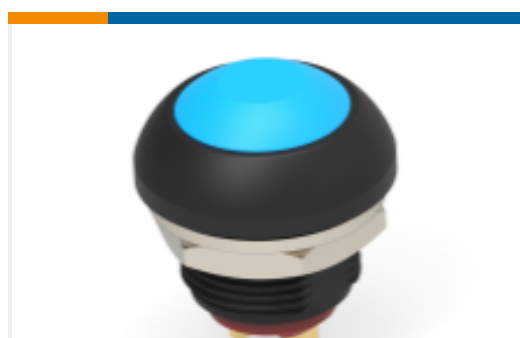
TE 产品编号2-2329383-5 PB ON/OFF FC BLU M1 TERM IP68