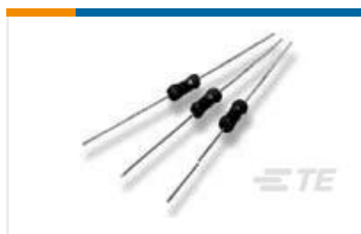
TE 产品编号1-1625893-4 5W SM M/OX 2% 27R