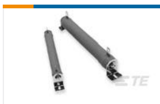
TE 产品编号1-1879447-8 TE 200W 27R 5% Bracket