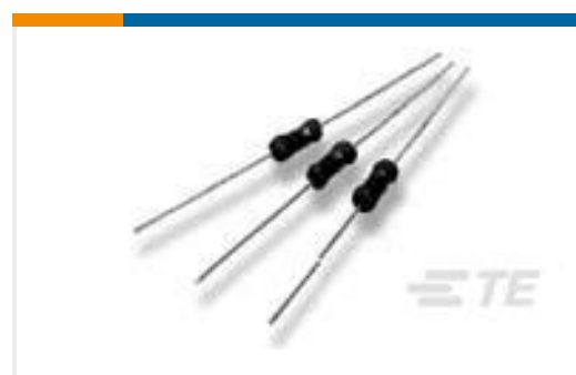
TE 产品编号7-1879350-5 RR01 5% 270R AMMO