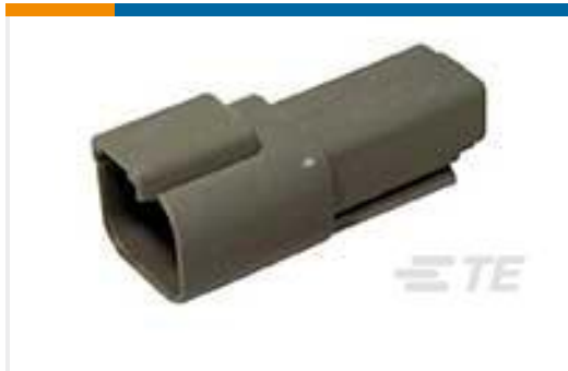
TE 产品编号DT04-2P REC, 2P, GRY, N