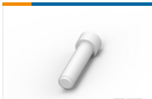
TE 产品编号114017-ZZ SEALING PLUG, SIZE 12/16, WHT