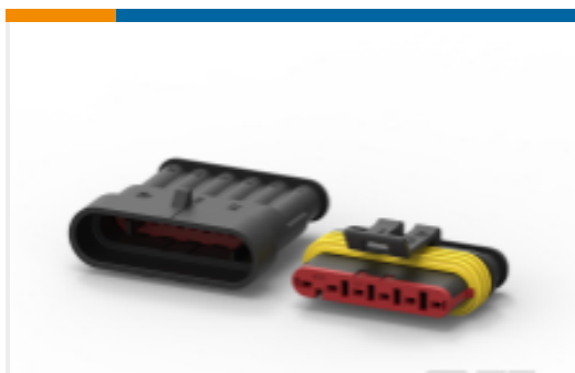
TE 产品编号282104-1 AMP SUPERSEAL 1.5MM, 连接器壳体