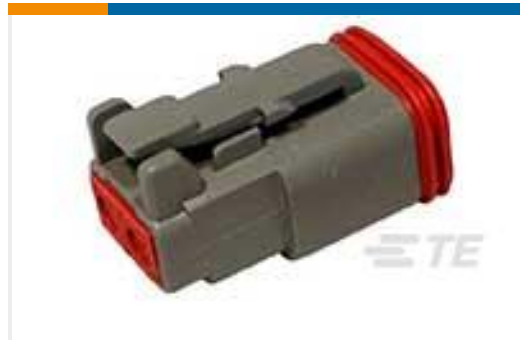
TE 产品编号DT06-2S PLG, 2P, GRY, N