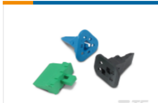
TE 产品编号W2S Wedgelocks: DEUTSCH DT