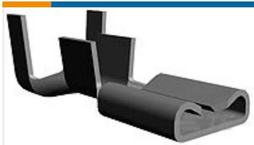
TE 产品编号42845-2 250 FASTON REC 18-14 AWG TPBR