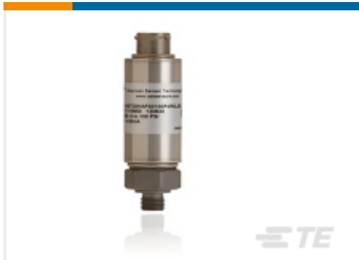
TE 产品编号11191401-00 AST20HAA05000P511H000:CTO-13000000-04