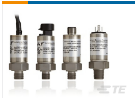
TE 产品编号11104267-00 AST4000F05000P4D0000:CTO-13000000-02