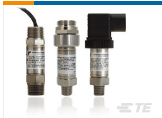
TE 产品编号11105776-00 AST4300A00200P4L1000-SS:CTO-13000000-03