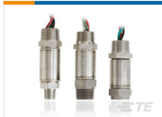
TE 产品编号11108663-00 300 PSI, 1/4MNPT, 4-20mA, Conduit, 18AWG