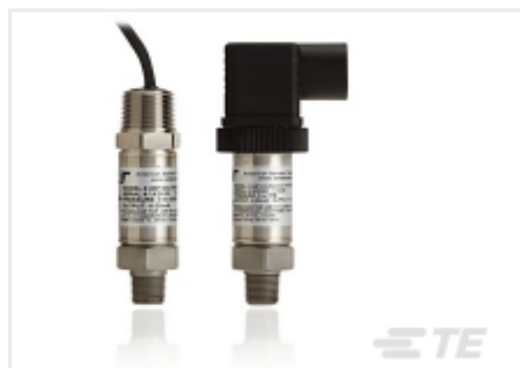
TE 产品编号11106838-00 1 PSI, 1/4MNPT, 4-20mA, Conduit, 316L, 2