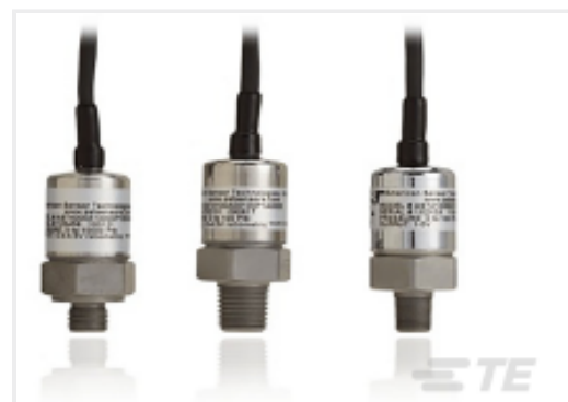
TE 产品编号11105219-00 AST4100B00150P4A0000:CTO- 13000000-02