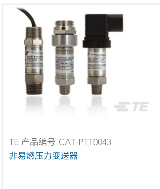
TE 产品编号 CAT-PTT0043 非易燃压力变送器