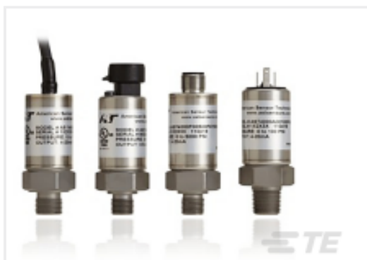
TE 产品编号11102056-00 AST4000A00150P4E1000:CTO- 13000000-02