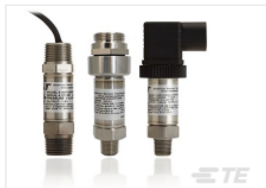
TE 产品编号11105830-00 300 PSI, 1/4MNPT, 4-20mA, Conduit, 2ft.