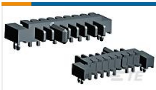
TE 产品编号1827654-1 2mm pitch Battery Plug Assy. 7Pos. H=4.0