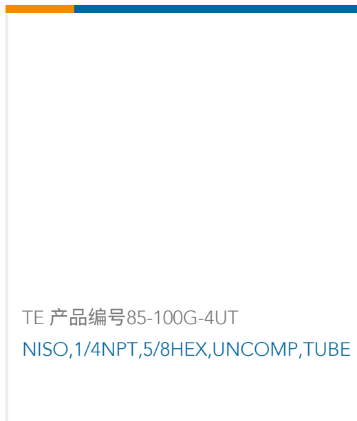
TE 产品编号85-100G-4UT NISO,1/4NPT,5/8HEX,UNCOMP,TUBE