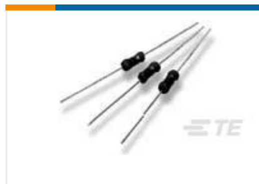
TE 产品编号7-1879350-5 RR01 5% 270R AMMO