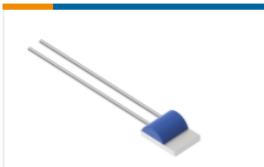
TE 产品编号NB-PTCO-159 Pt100, 2.0x2.3, Class C, PTFC101C1A0