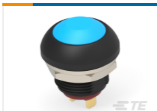
TE 产品编号2-2329383-5 PB ON/OFF FC BLU M1 TERM IP68