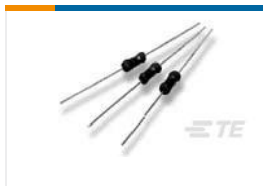
TE 产品编号1-1625893-4 5W SM M/OX 2% 27R