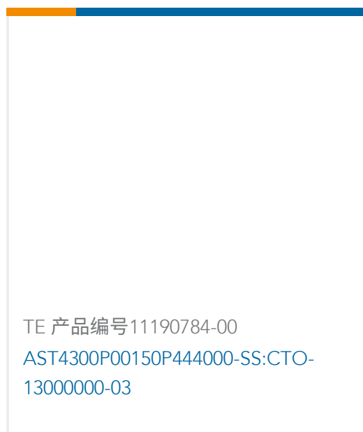
TE 产品编号11190784-00 AST4300P00150P444000-SS:CTO-13000000-03