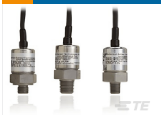
TE 产品编号11105219-00 AST4100B00150P4A0000:CTO-13000000-02