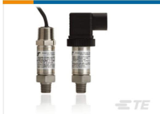
TE 产品编号11106838-00 1 PSI, 1/4MNPT, 4-20mA, Conduit, 316L, 2