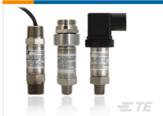
TE 产品编号11105644-00 非易燃压力变送器