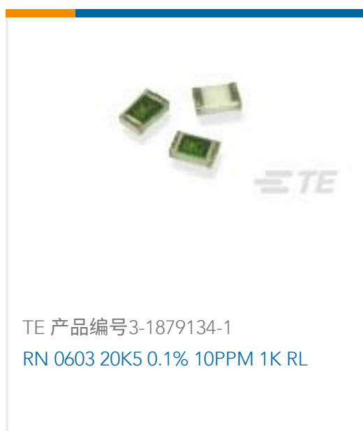
TE 产品编号3-1879134-1 RN 0603 20K5 0.1% 10PPM 1K RL