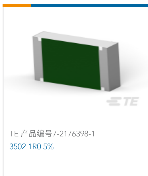
TE 产品编号7-2176398-1 3502 1R0 5%