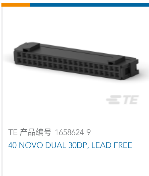
TE 产品编号 1658624-9 40 NOVO DUAL 30DP, LEAD FREE