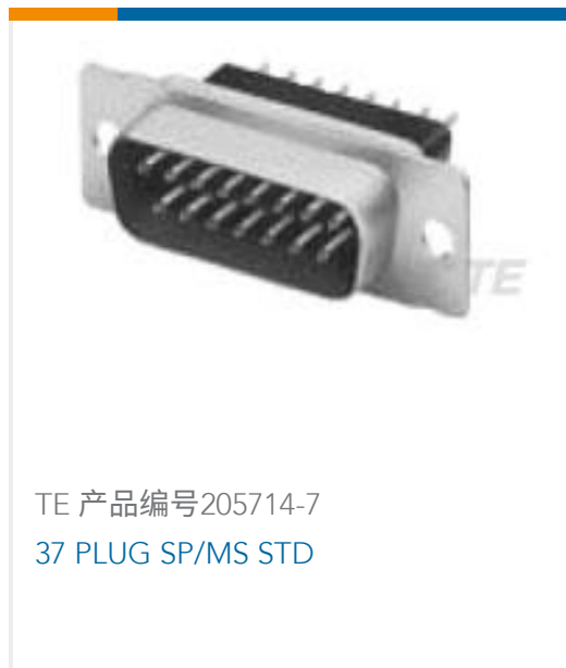
TE 产品编号205714-7 37 PLUG SP/MS STD