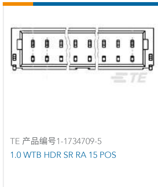
TE 产品编号1-1734709-5 1.0 WTB HDR SR RA 15 POS