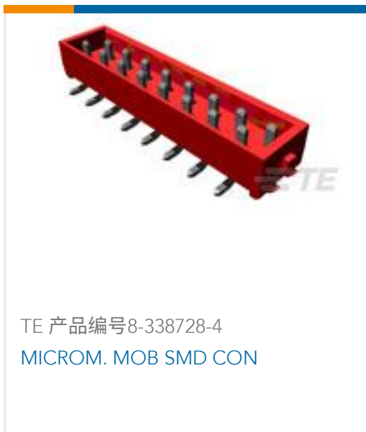
TE 产品编号8-338728-4 MICROM. MOB SMD CON