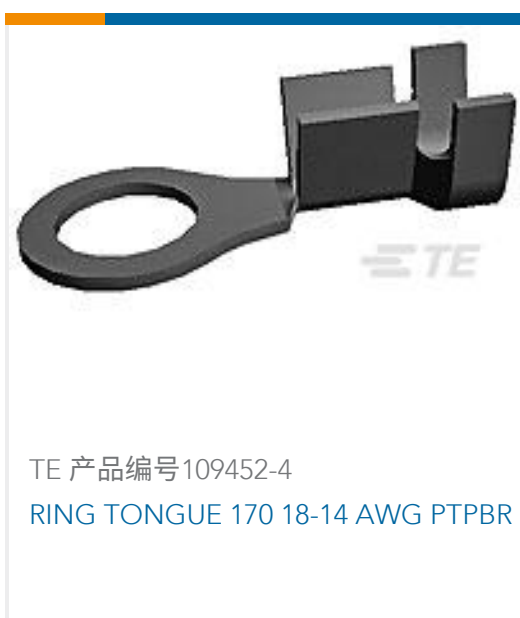
TE 产品编号109452-4 RING TONGUE 170 18-14 AWG PTPBR