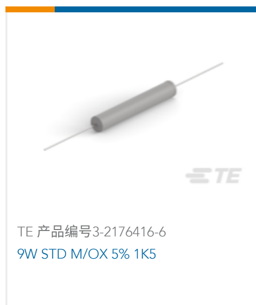
TE 产品编号3-2176416-6 9W STD M/OX 5% 1K5