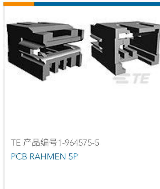
TE 产品编号1-964575-5 PCB RAHMEN 5P