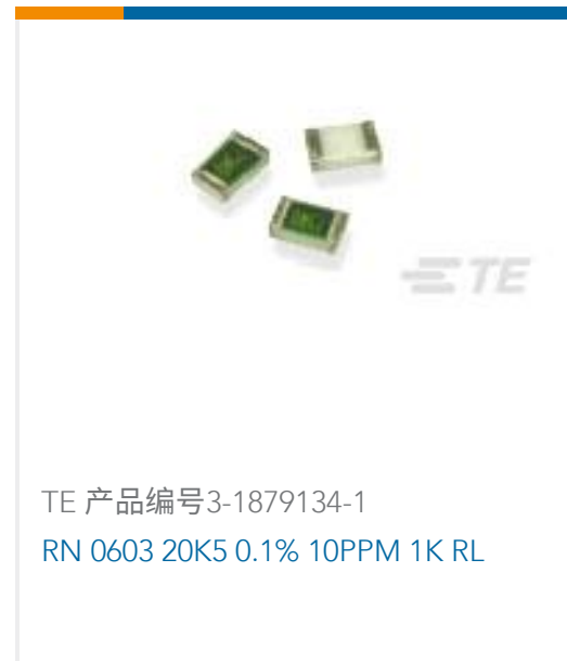
TE 产品编号3-1879134-1 RN 0603 20K5 0.1% 10PPM 1K RL