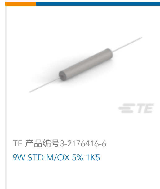
TE 产品编号3-2176416-6 9W STD M/OX 5% 1K5