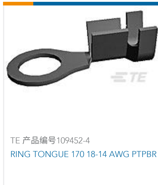
TE 产品编号109452-4 RING TONGUE 170 18-14 AWG PTPBR