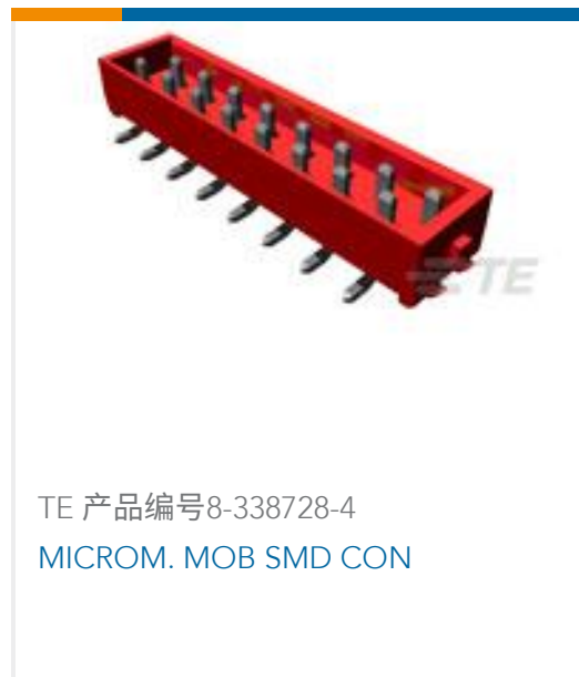
TE 产品编号8-338728-4 MICROM. MOB SMD CON