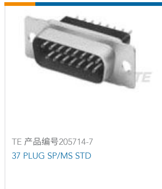
TE 产品编号205714-7 37 PLUG SP/MS STD