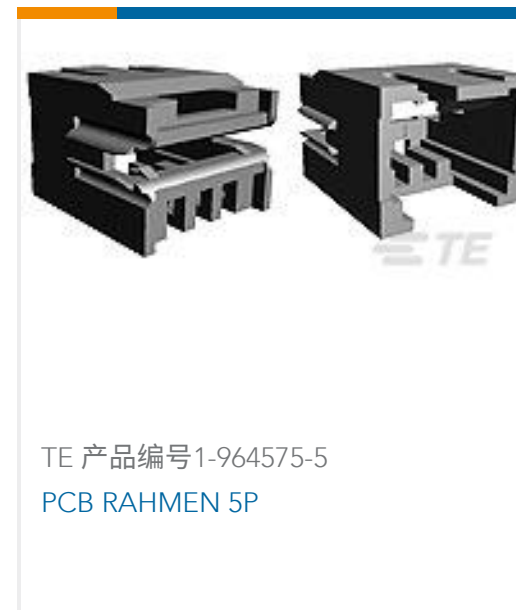
TE 产品编号1-964575-5 PCB RAHMEN 5P