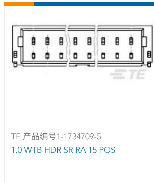
TE 产品编号1-1734709-5 1.0 WTB HDR SR RA 15 POS