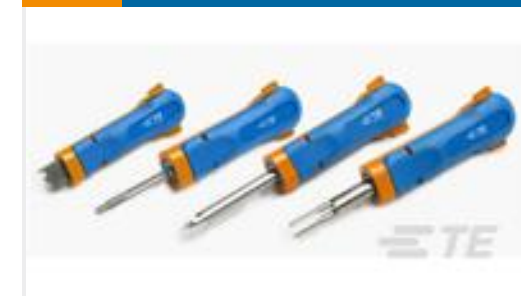
TE 产品编号539972-1 EXTRACTION TOOL