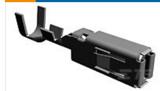
TE 产品编号1-968857-3 AMP MCP 2.8, CONTACT SWS