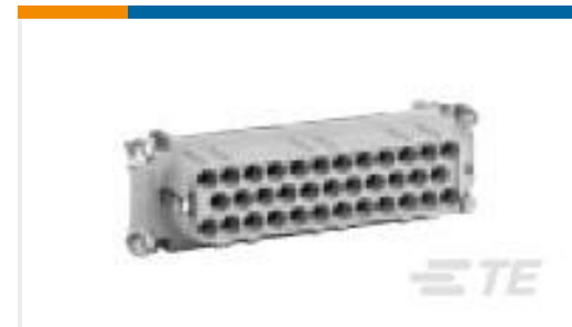
TE 产品编号2-1104014-3 HVT.35.BU.C