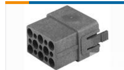
TE 产品编号1103017-2 MDL2.HN.D.15.BU.C