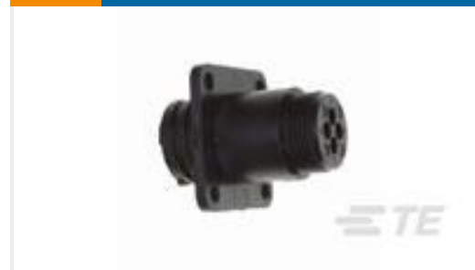
TE 产品编号206061-1 RECPT, SZ 11-4, CPC