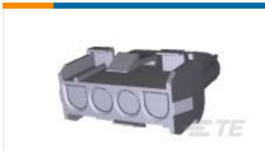
TE 产品编号350780-1 04P UMNL CAP HSG