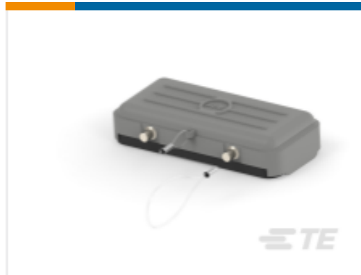
TE 产品编号T1010161600-000 H16B-KDTP-BO