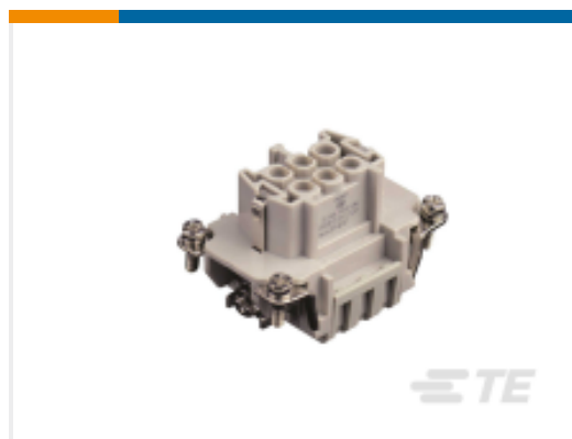
TE 产品编号T2040064201-000 HE-006-FC