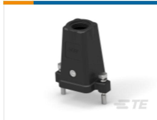
TE 产品编号T1926030116-009 H3APR-TGC-M16-EMC-C