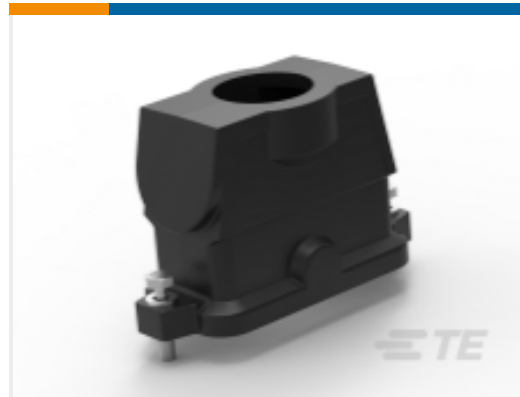
TE 产品编号T1922160140-000 H16BPR-TGHC-M40