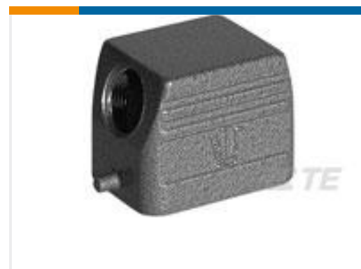
TE 产品编号1106419-7 HB.6.STS.1.M20.G