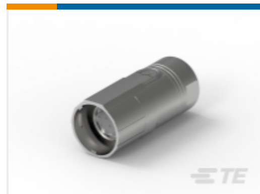
TE 产品编号ASA021F01620100000 623 PLUG, SPEEDTEC