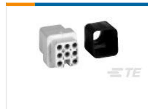
TE 产品编号2-1103001-3 HD.7.BU.C. 250 V