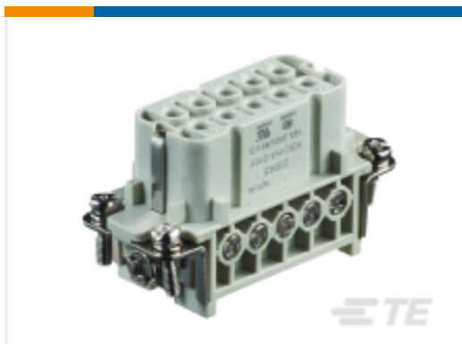
TE 产品编号T2010102201-000 HA-010-F