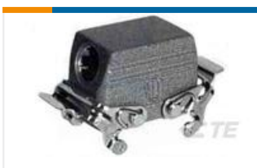
TE 产品编号1106449-6 HB.16.STS-VS.1.M32G