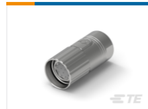
TE 产品编号ASA021F01620235000 623 PLUG