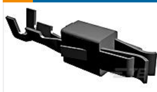
TE 产品编号927771-1 JPT REC 2.8 Contact SRC Sn