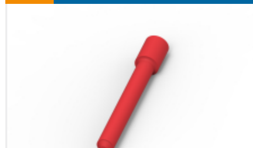
TE 产品编号0413-204-2005 SEALING PLUG, SIZE 20, RED