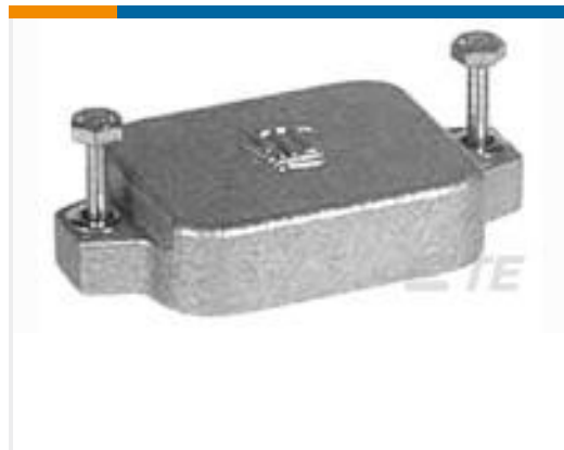
TE 产品编号4-1106201-5 HIPK/EMVK.6/16.SKB