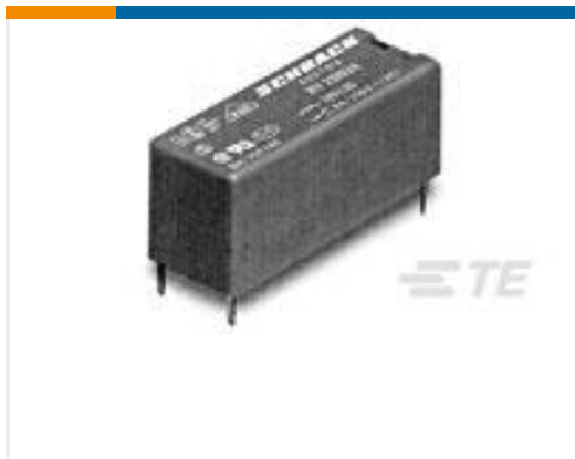
TE 产品编号4-1393224-6 RY211012