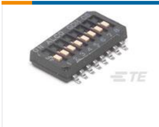
TE 产品编号1571983-1 GDH02S04=DIP SWITCH