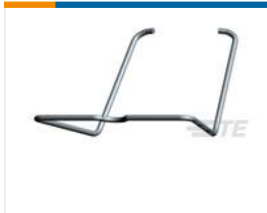
TE 产品编号5-1419111-9 PT28800