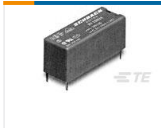
TE 产品编号4-1393224-9 RY211024