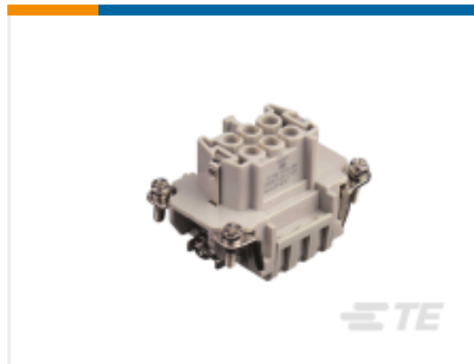
TE 产品编号T2040064201-000 HE-006-FC