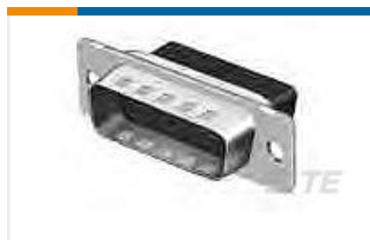
TE 产品编号167294-1 25P HDP20 PLUG ASSY