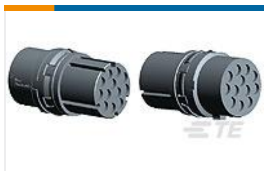
TE 产品编号1103432-1 HC26.Bu.12.C