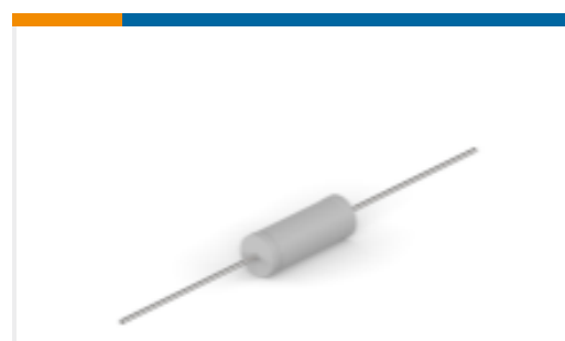
TE 产品编号1-2176412-0 5W XSM M/OX 5% 12R