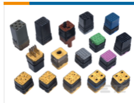
TE 产品编号ZPF000000000202094 DMC-M 0402 AW 01