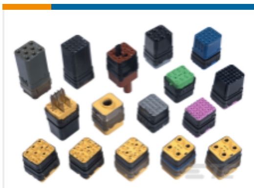
TE 产品编号ZPF00000000203708 DMC-M 99-10 PC