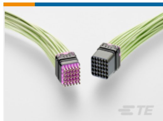
TE 产品编号ZPF00000000203398 DMC-MR 30-23 PC