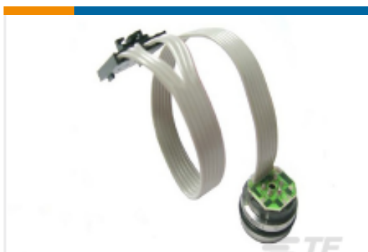
TE 产品编号86-100G-R 100 PSIG RIBBON CABLE MV PRESSURE SENSOR