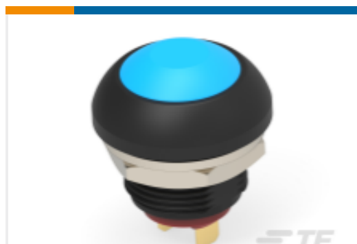
TE 产品编号2-2329383-5 PB ON/OFF FC BLU M1 TERM IP68