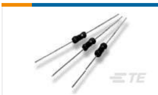
TE 产品编号4-1879355-9 RR03 5% 430K AMMO