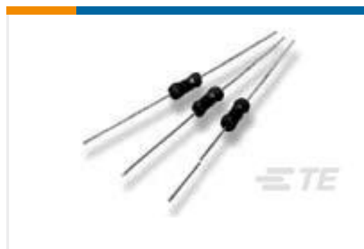
TE 产品编号1-1625893-4 5W SM M/OX 2% 27R