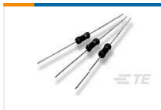
TE 产品编号7-1879350-5 RR01 5% 270R AMMO