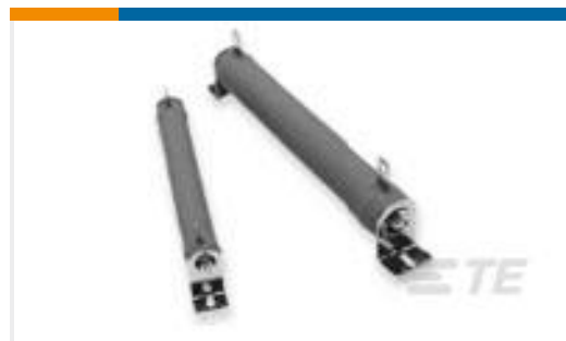
TE 产品编号1-1879447-8 TE 200W 27R 5% Bracket