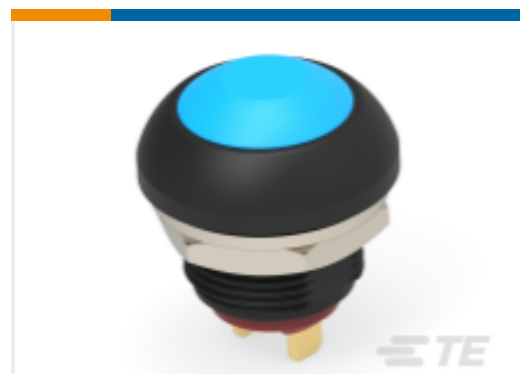
TE 产品编号2-2329383-5 PB ON/OFF FC BLU M1 TERM IP68