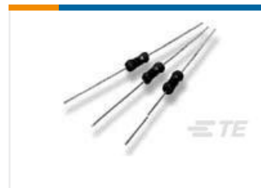
TE 产品编号7-1879350-5 RR01 5% 270R AMMO