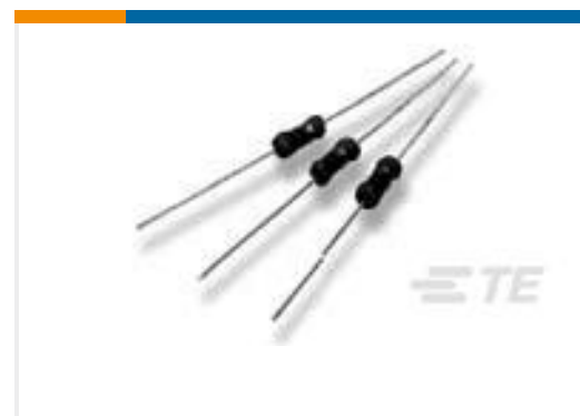
TE 产品编号1-1625893-4 5W SM M/OX 2% 27R