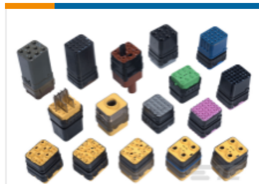
TE 产品编号 ZPF00000000203708 DMC-M 99-10 PC