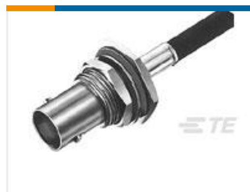
TE 产品编号 225398-6 CONNECTOR, BNC DUAL CRIMP JACK