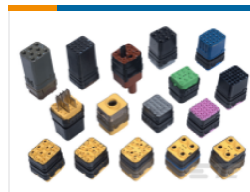
TE 产品编号 ZPF00000000202094 DMC-M 0402 AW 01