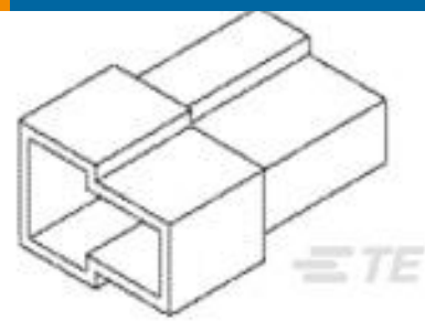
TE 产品编号180908 FF 250 TAB HSG 2P NYLON NAT