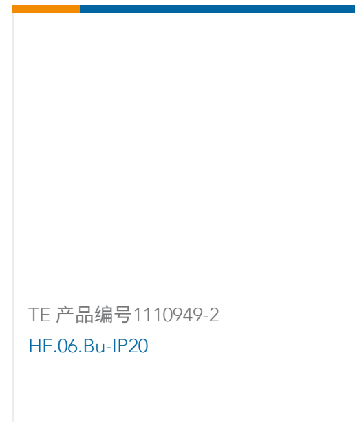
TE 产品编号1110949-2 HF.06.Bu-IP20