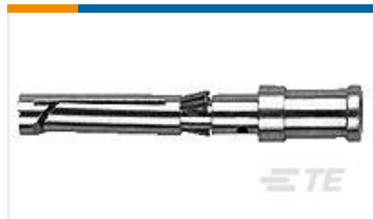
TE 产品编号2-1105051-1 HN.D-C-BU.AG.0,5