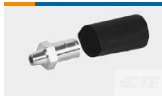
TE 产品编号1-1110952-0 HF.06-CH-70 qmm-SW17