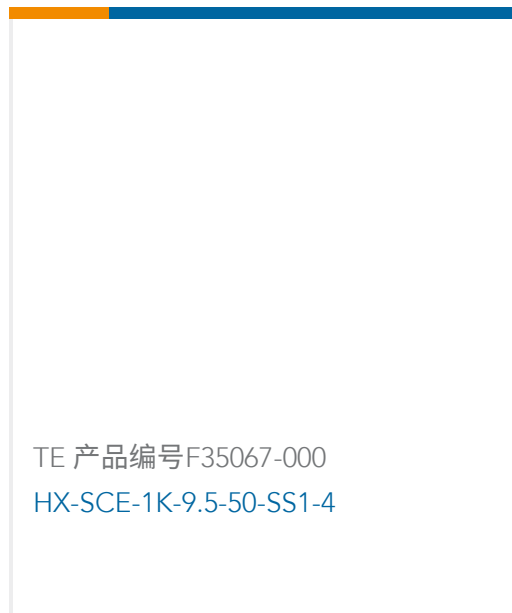
TE 产品编号F35067-000 HX-SCE-1K-9.5-50-SS1-4